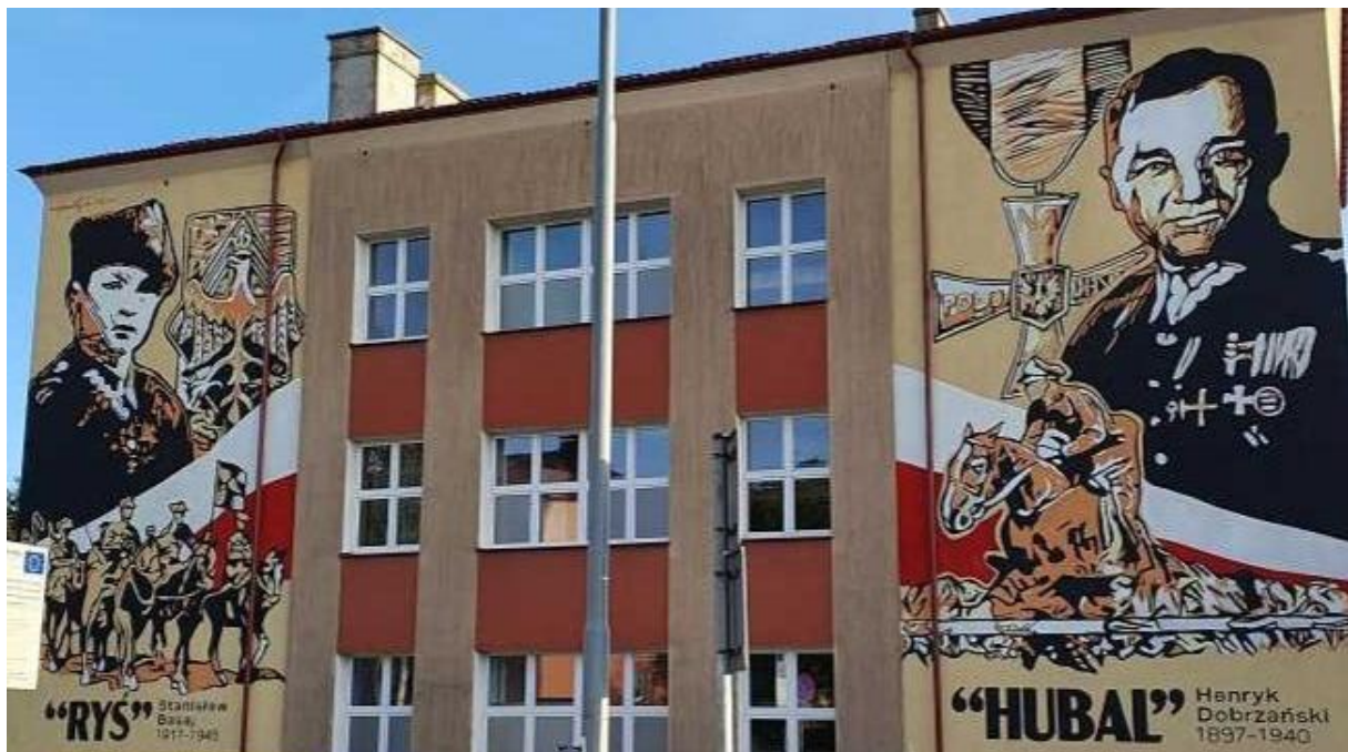
Zdjęcie 9 Mural Stanisława Basaja „Rysia” oraz Henryka Dobrzańskiego „Hubala” na budynku szkoły podstawowej nr. 2 im. Kardynała Stefana Wyszyńskiego w Hrubieszowie .