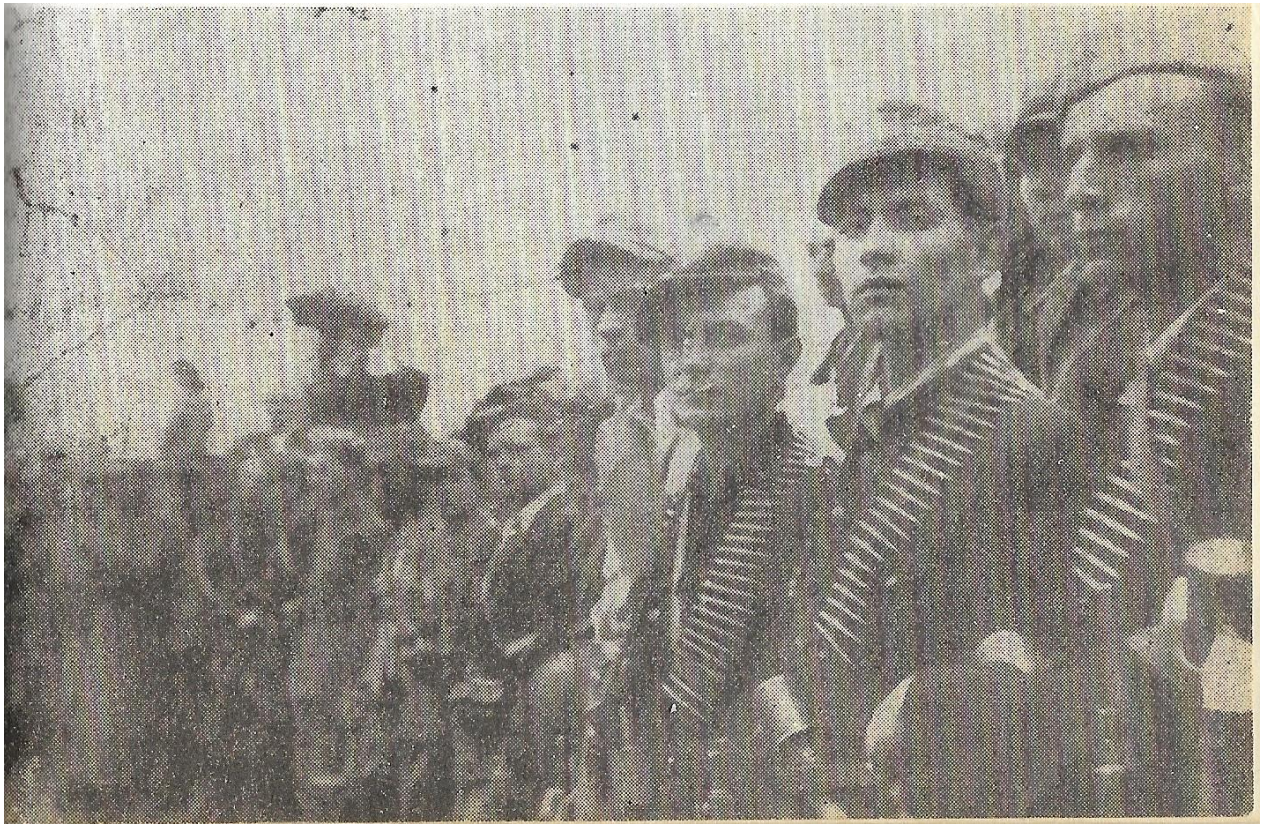
Zdjęcie 1 Pluton dowodzenia Kwatery Głównej batalionu „Rysia”.

Mirczem, Poturzynem i Kosmowem w powiatach hrubieszowskim i tomaszowskim). Już wtedy okupacyjne władze niemieckie wyznaczyły dużą nagrodę za schwytanie lub zabicie Basaja.