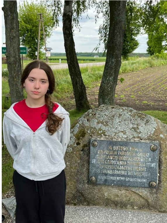
Zdjęcie 6 Tablica pamiątkowa w m. Małków informują iż w dniu 14.02.1944 na polach Zabłocia-Górki partyzancki oddział „Rysia” stoczył całodzienną bitwę z przeważającymi siłami SS i Żandarmerii Niemieckiej