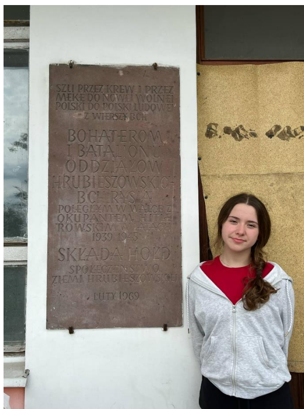
Zdjęcie 5 Tablica umiejscowiona na dawnym budynku Szkoły Podstawowej w Małkowie.

Podczas zbierania materiałów do mojej pracy odwiedziłam miejsca związane ze szlakiem bojowym Stanisława Basaja ps „Ryś” . Poniżej przedstawię fotografie upamiętniające mojego bohatera .