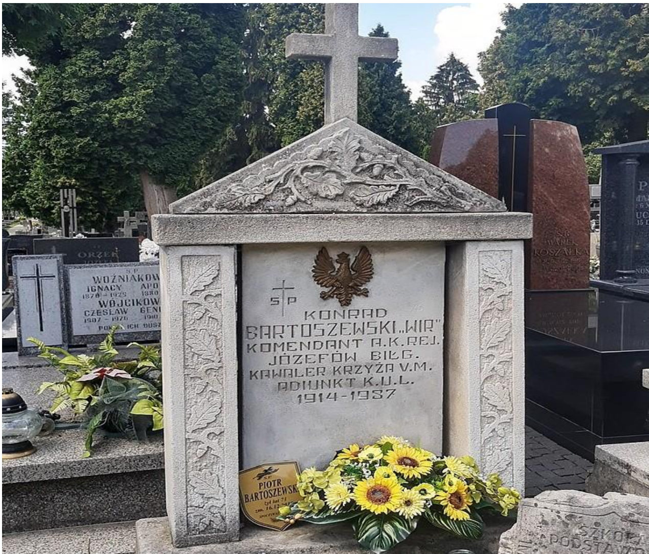
Grób Konrada Bartoszewskiego na cmentarzu przy Lipowej w Lublinie.