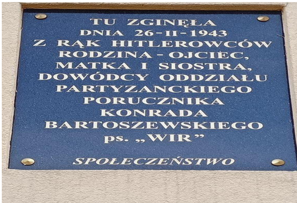
UPAMIĘTNIENIE 81. ROCZNICY ZAMORDOWANIA RODZINY KONRADA BARTOSZEWSKIEGO PS. „WIR” – Józefów, 25 luty 2024