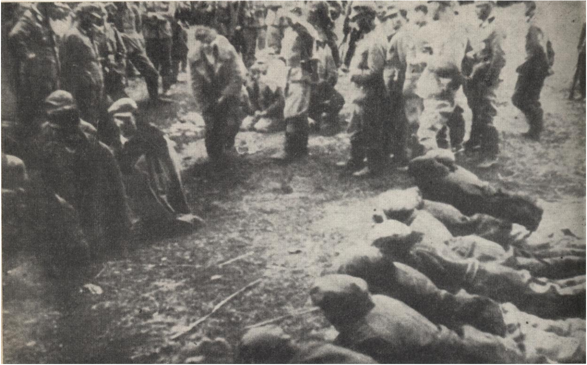
Egzekucja wziętych do niewoli partyzantów. Uroczysko Mariarze, 25 czerwca 1944 r.