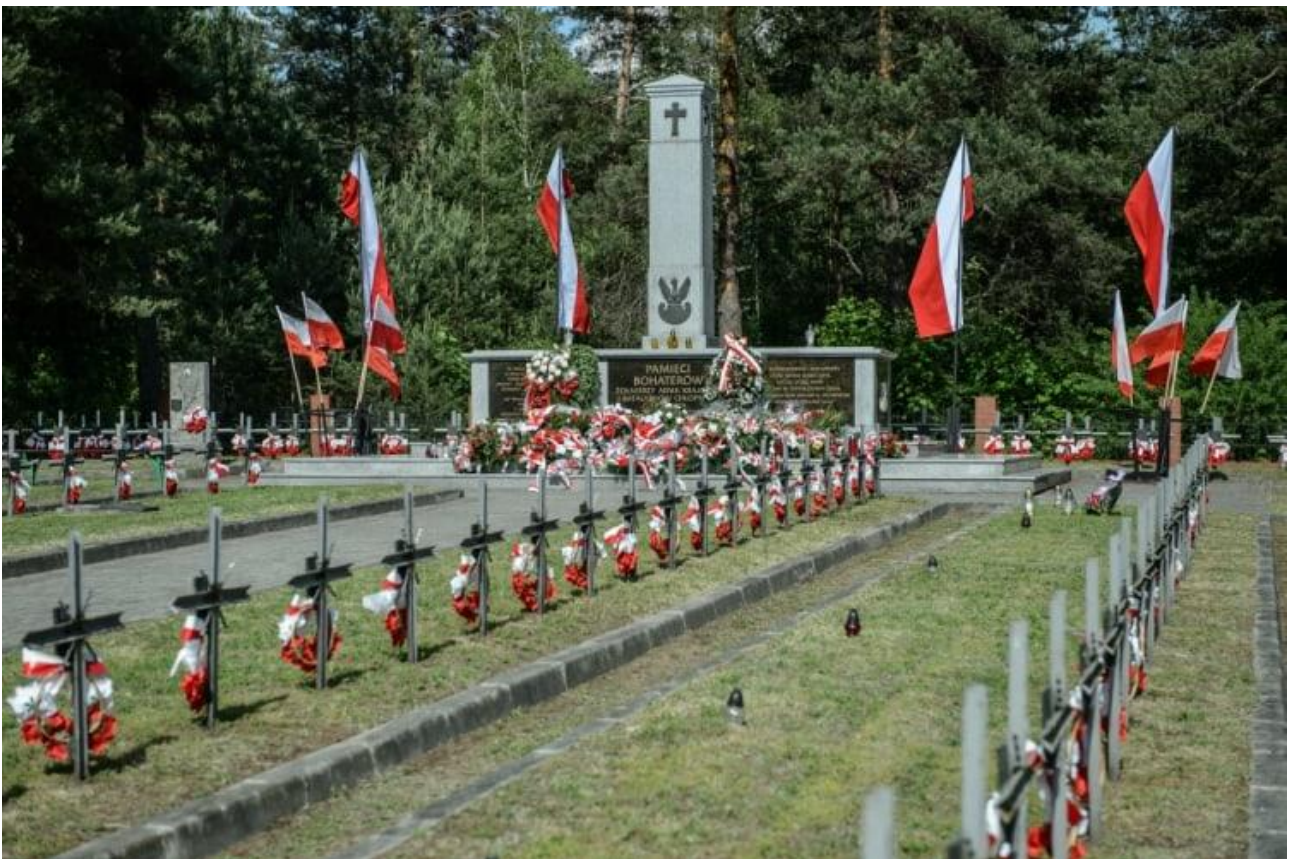
Pomnik pamięci poległych żołnierzy AK i BCh w bitwie pod Osuchami.