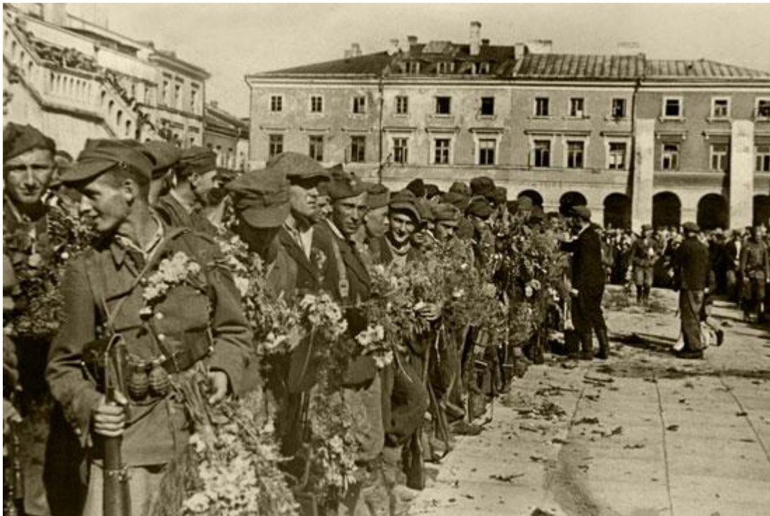
Żołnierze AK witani w 1944 roku po wkroczeniu do Zamościa