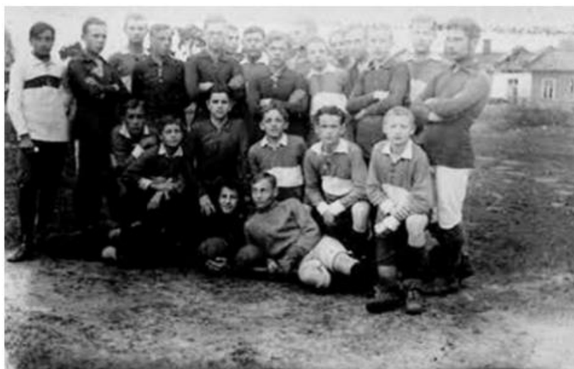
Uczniowska drużyna piłki nożnej (rok szkolny 1922/1923). Źródło: „Kronika Państwowego Gimnazjum...”, t. I, s. 57