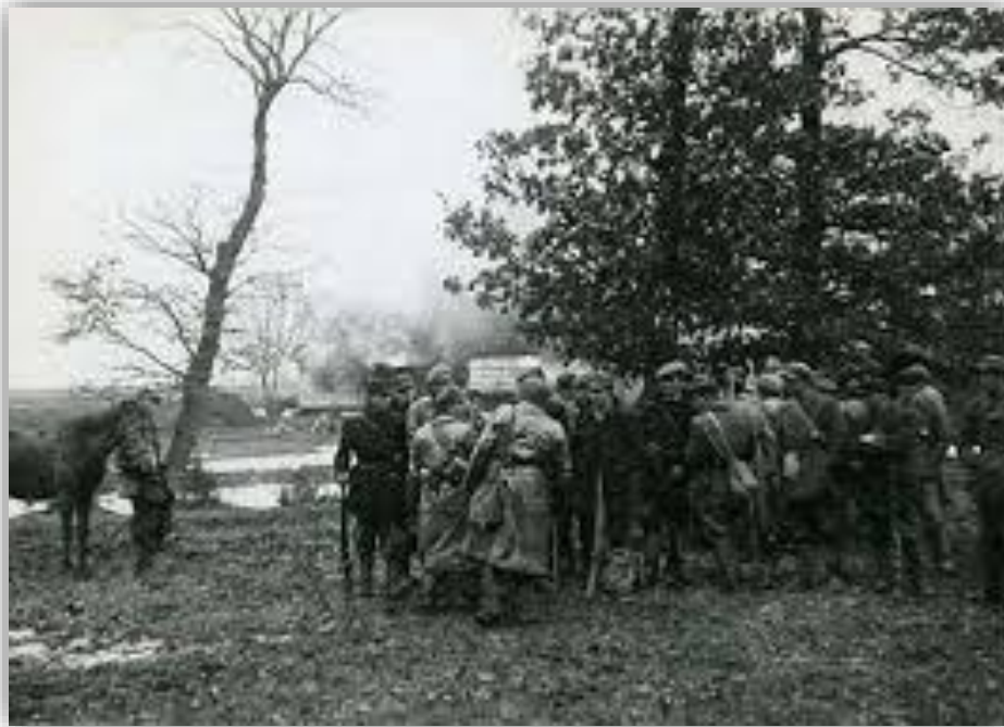
Partyzanci szykujący się do akcji pod Saharyniem

W dniu 19 października oddział ODB pod dowództwem Stefana Kwaśniewskiego „Wiktor” dokonał udanej akcji na posterunek policji ukraińskiej w Mienianach 7 .