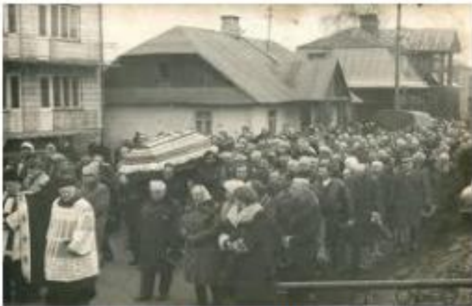
Pogrzeb w Komarowie