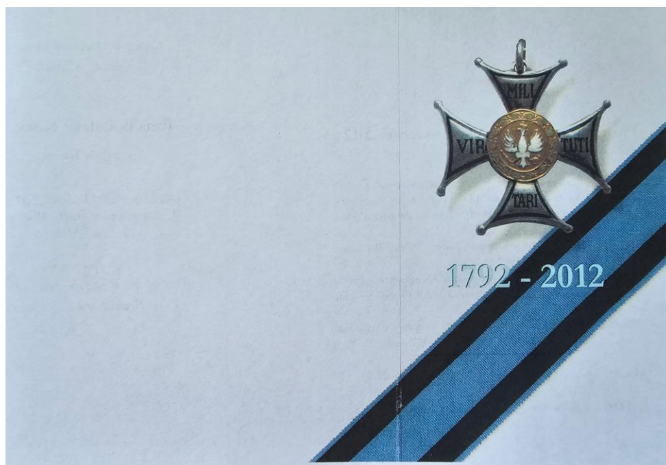
[zdj. 26] jak wyżej, pierwsza strona programu.