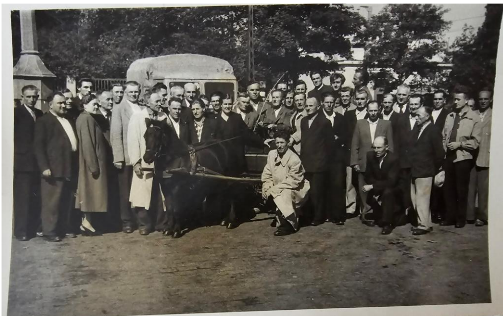
[zdj. 17] Wycieczka do Bułgarii zorganizowana przez B. Kukielkę dla plantatorów tytoniu