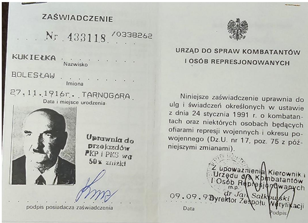
[zdj. 4] Pierwsza strona zaświadczenia z Urzędu do Spraw Kombatantów i Osób Represjonowanych.