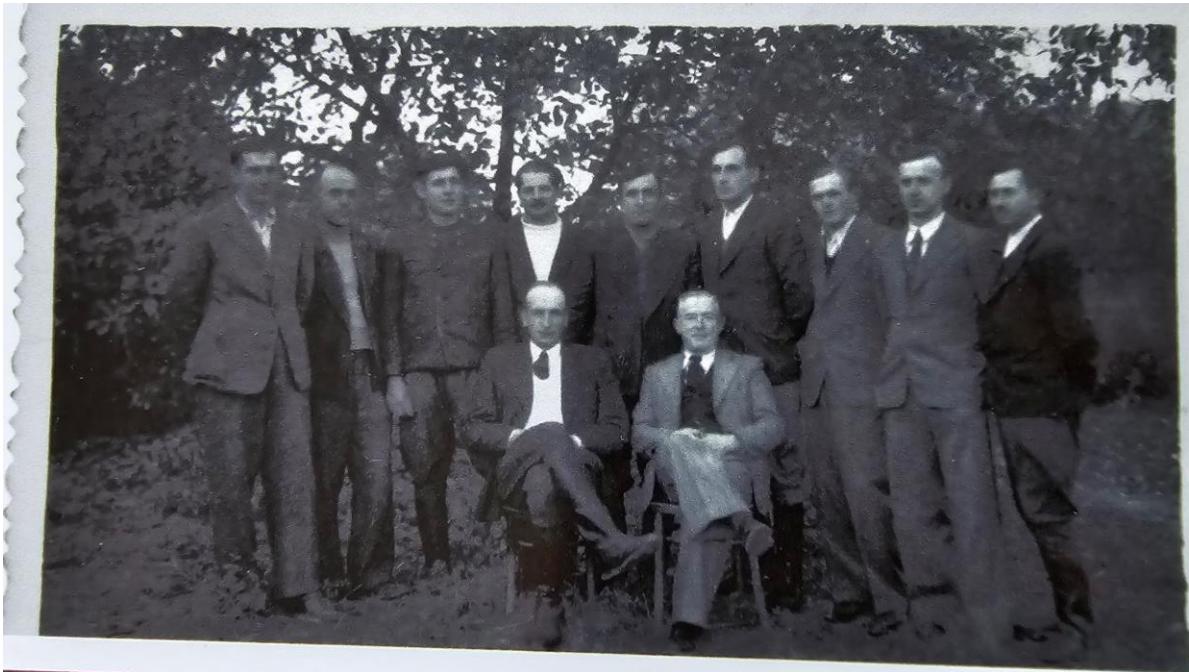
[zdj. 9] Kukiełka z działaczami konspiracji; pierwszy od lewej w dolnym rzędzie.