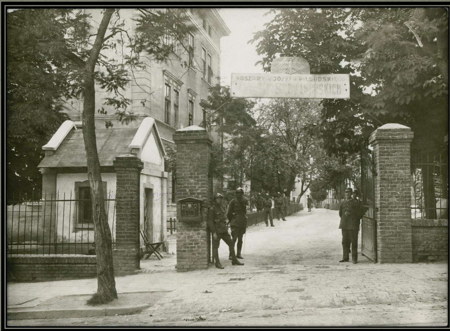
Koszary 40 Pułku Piechoty Dzieci Lwowskich