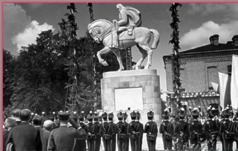
Szkoła Podchorążych Piechoty w Komorowie