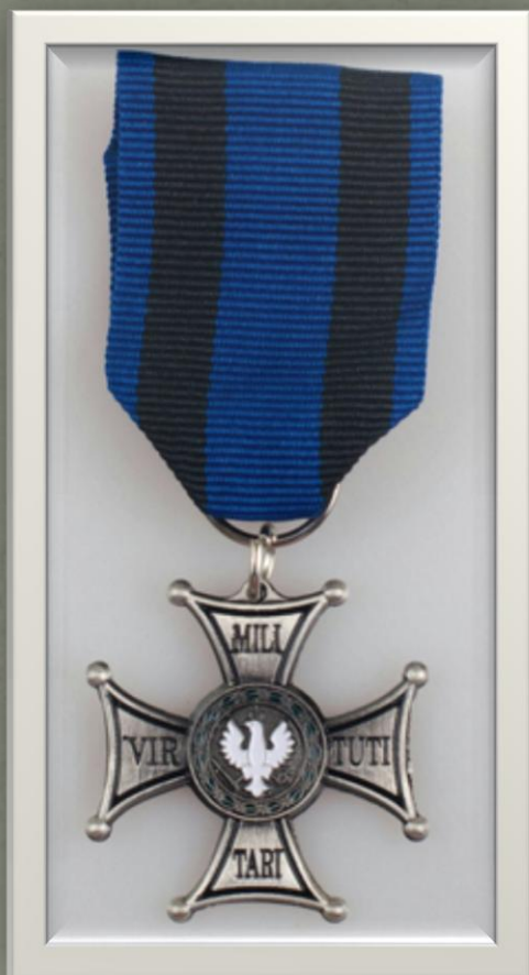
Order Virtuti Militari