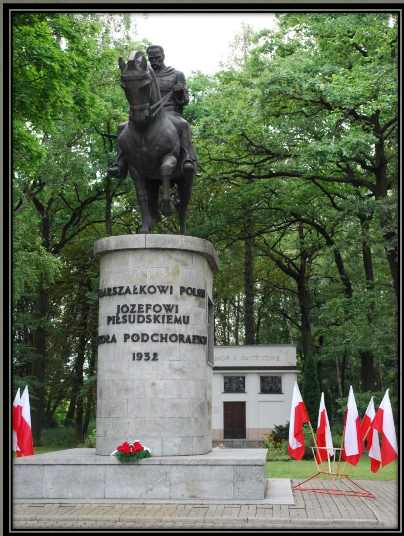
Pomnik Józefa Piłsudskiego przy Szkole Podchorążych Piechoty w Komorowie.

Ze względu na wybuch działań wojennych został promowany na podporucznika.