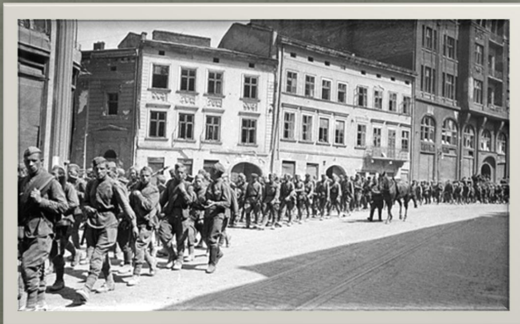
Wejście Armii Czerwonej do Lwowa 22 września 1939r.

Rankiem 22 września 1939r. polska delegacja na czele z gen. Władysławem Langnerem ponownie spotkała się w Winnikach z przedstawicielami Armii Czerwonej. Przyjęto wtedy wszystkie warunki poddania miasta. 22 września 1939r. o godzinie 14.00 polskie wojska zaczęły składać broń. O godzinie 15.00 oddziały radzieckie wkroczyły do miasta i zajęły je całkowicie do godziny 16.00