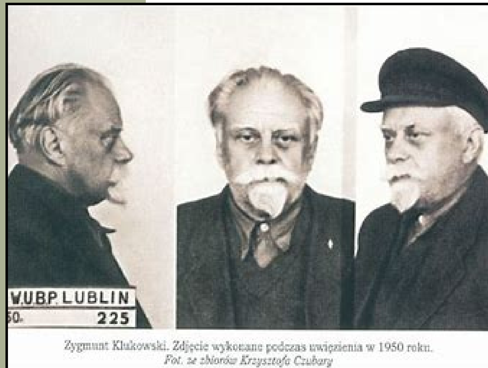
Zygmunt Klukowski. Zdjęcie wykonane podczas uwięzienia w 1950 roku.

Warto zwrócić uwagę na działalność lekarzy Zygmunta Klukowskiego i Stanisława Pojaska, którzy w czasie II wojny światowej prowadzili szpitale na terenie Puszczy Solskiej i jednocześnie działali w polskim podziemiu.