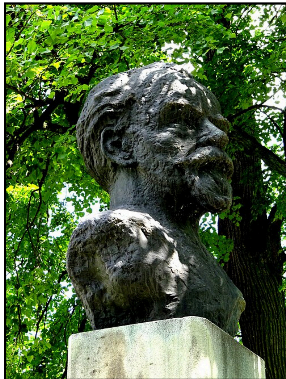
POMNIK ZYGMUNTA KLUKOWSKIEGO W SZCZEBRZESZYŃNIE

PREZYDENT RZECZYPOSPOLITEJ Bolesław Bierut