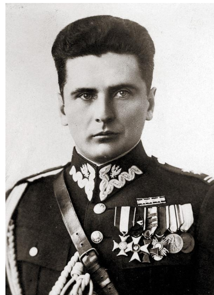
Generał Stefan Rowecki „Grot”