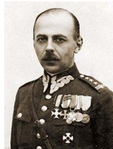
Tadeusz Komorowski „Bór”