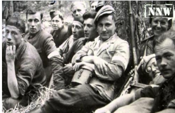
Dowódca ODB Obw. Tomaszów Lub. AK “Wiktor” ze swymi żołnierzami (oparty o drzewo).

wrześniowej uniknął niewoli, powrócił do rodzinnego Komarowa i na początku 1940 roku wstąpił do SZP, stając się współtwórcą tej organizacji na tym terenie. Na przełomie 1940 i 1941r. “Wiktor” został dowódcą oddziałów szturmowych i dywersji bojowej Związku Walki Zbrojnej (ZWZ) w obwodzie tomaszowskim. Podlegały mu także oddziały leśne. Funkcję tą sprawował do końca okupacji niemieckiej. W jej trakcie przeprowadził kilkadziesiąt akcji zbrojnych i dywersyjnych przeciwko Niemcom oraz oddziałom UPA.