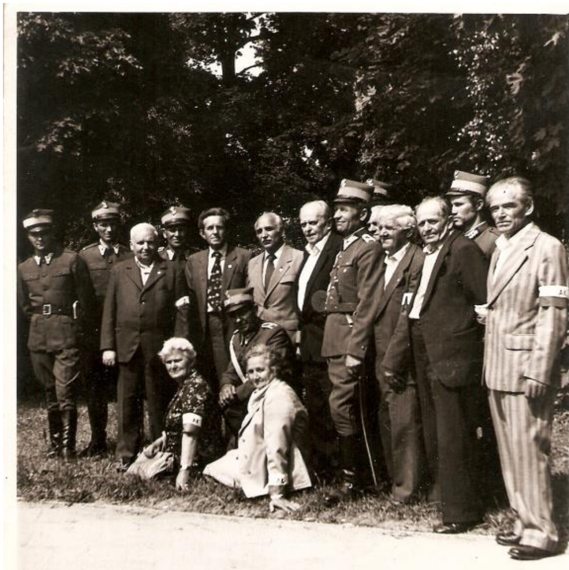
Rok 1981; „Wir” i „Podkowa” w otoczeniu partyzantów Rzeczpospolitej Józefowskiej