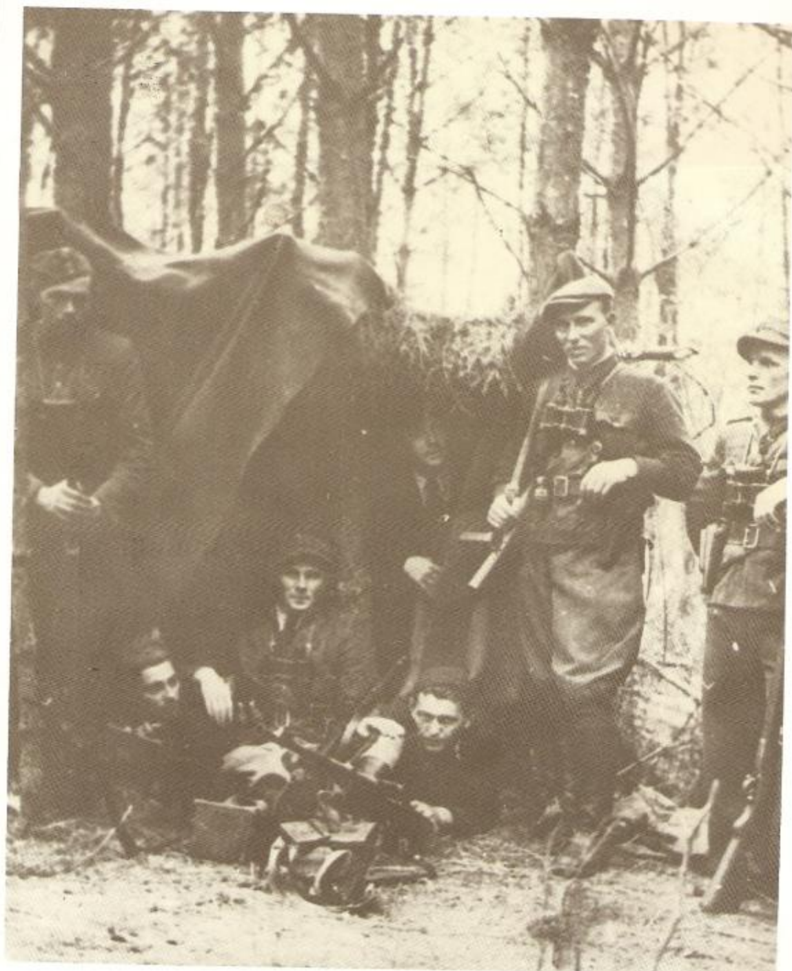
Oddział „Groma” na placówce